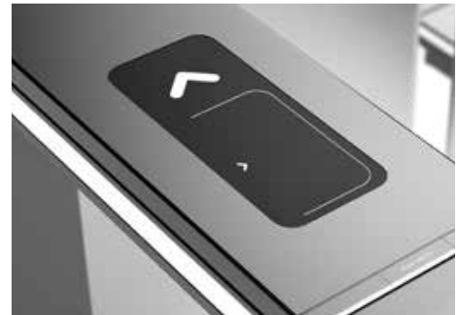
Kortlæser cover (valgfri)